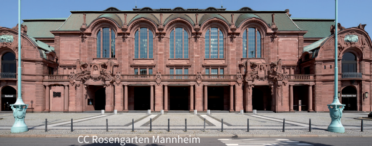
CC Rosengarten Mannheim